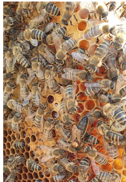
Včelky v pilné práci