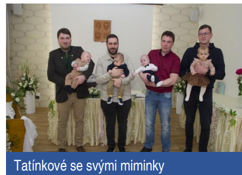
Tatínkové se svými miminky