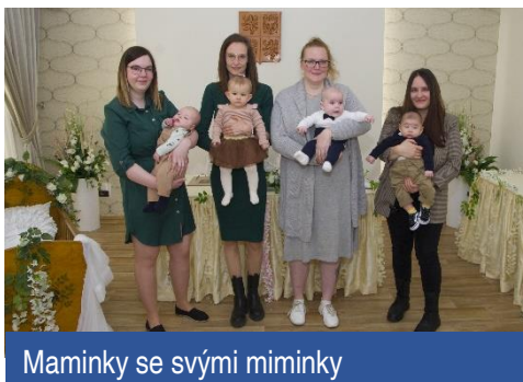
Maminky se svými miminky