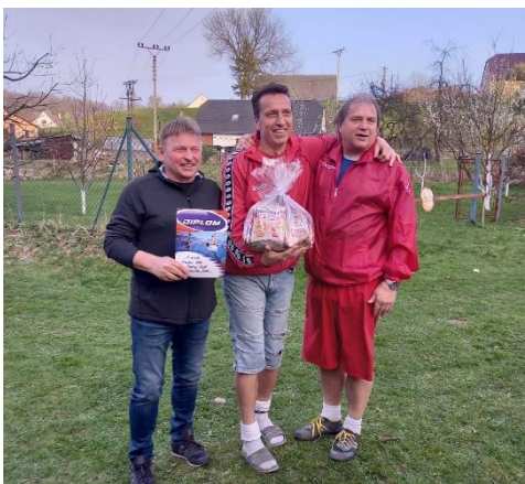
Borci na 1. místě