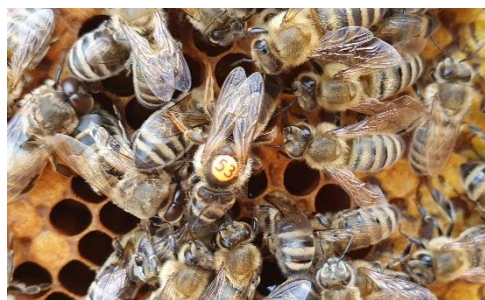
Včelí královna s č. 53

Včely létavky přinesou do úlu nektar s pylem, „složí“ ho na určeném místě. Pak se ho chopí další včely, které ho zpracují ve svých medových váčcích na konzistenci, která se nezkazí, a odnesou ho dalším včelám, které ho uloží do buňky plástu, kde je nektar vysušován a zahušťován při vyšších teplotách, dokud není zralý. Minimální vlhkost musí být asi 17 %. Pak je již med zavíčkovaný v plástu voskem a čeká na zpracování včelařem. Správný včelař ví, že při stáčení medu musí nechat pro včely asi 20 % jejich produkce, aby se mohlo včelstvo dále vyvíjet a plodit další potomstvo.