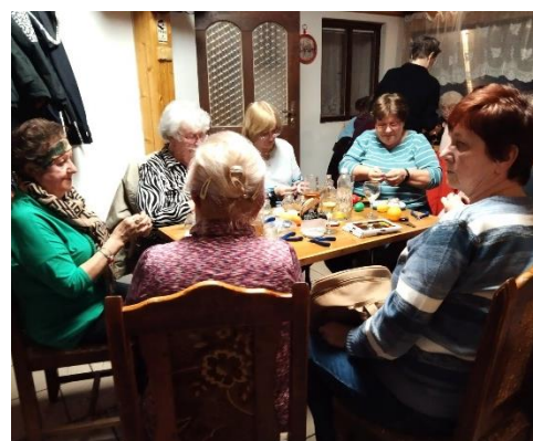
Kurz drátkování úspěšně dokončen