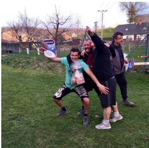
Borci na 2. místě