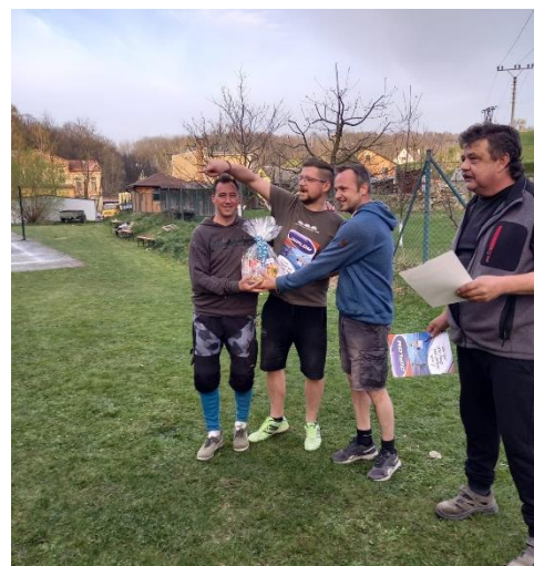
Borci na 3. místě