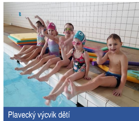
Plavecký výcvik dětí